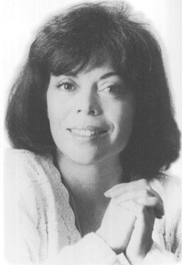
Siempre demostró aptitudes para nadar contra la corriente: dirigió protestas por causas que comprometían su espíritu juvenil.