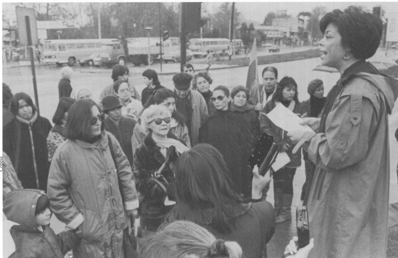
En una manifestación del movimiento Mujeres por la Vida, creado en 1983.

Hicieron una ceremonia de lanzamiento casi clandestina. La única manera de dar a conocer este texto «de facto» fue a través de un correo