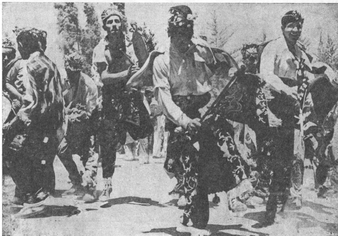
"Chinos" de la Virgen de la Candelaria de San Fernando, de Copiapó, con sus trajes cubiertos de alambres y ricos bordados con hilo de plata y oro