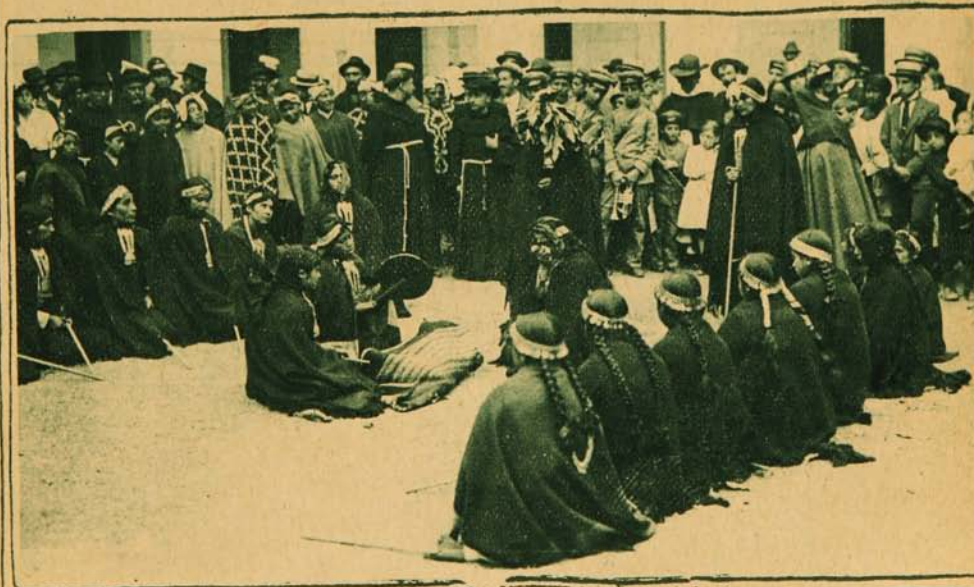
Los araucanos que asistieron a la inauguración del Congreso, ejecutan algunos bailes indígenas en el patio de la Universidad Católica.