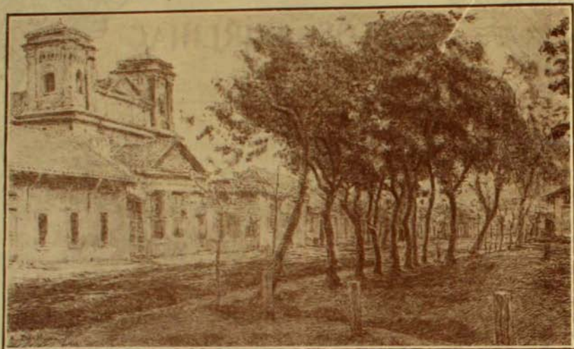
Iglesia de San Vicente (Chillán).