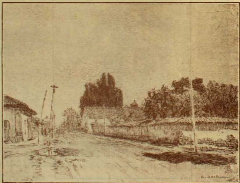
Huerto y capilla franciscanos.