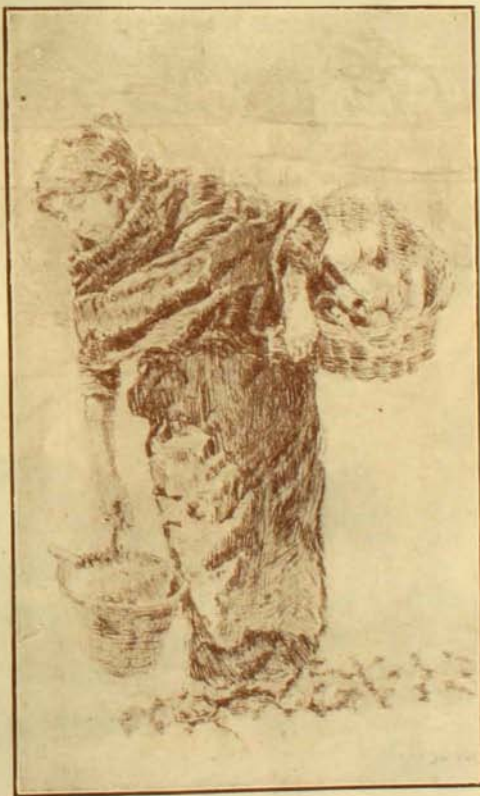
Mujer del pueblo.

Quizás porque la obra de Dorlhiac está toda ejecutada a pluma, porque carece de color, la simplicidad, la sencillez de la línea se destaca con mayor interés, con mayor fuerza; es como si el artista nos diera al