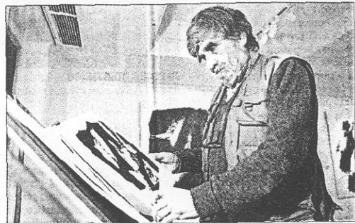
ENCUENTRO ESPERADO.— El artista dialoga sobre el tema de la muerte frente al gran poeta que es su amigo desde hace cincuenta años.

grande las serigrafías y versos de la publicación; hasta el 18 de este mes, se presentan en Galería Artium (Presidente Riesco 3210) las imágenes transformadas en pintura, al ser reproducidas digitalmente sobre tela re trabajada con pigmento. Y, desde el 14 de septiembre, la muestra estará en el Centro de Arte Moderno de Madrid, España.