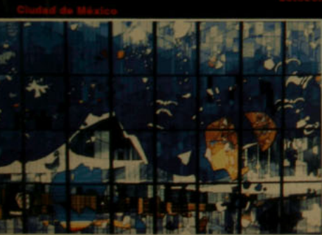
Ciudad de México