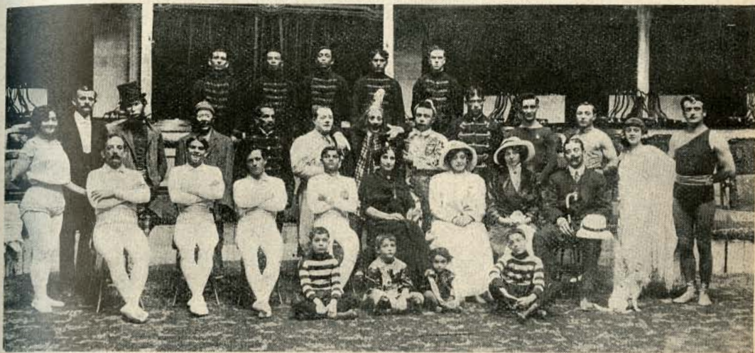
GRUPO GENERAL DE LOS ARTISTAS QUE COMPONEN ESTE CIRCO, LLEGADO RECIENTEMENTE Á SANTIAGO.

No es éste un circo vulgar y que pueda equipararse á tanto circo como suele llegar por estos lados, tan abandonados de Dios. Los numerosos espectadores que noche á noche acuden á este