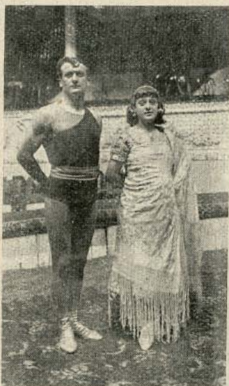
Los Pozzoli. Equilibrista y bailarina.