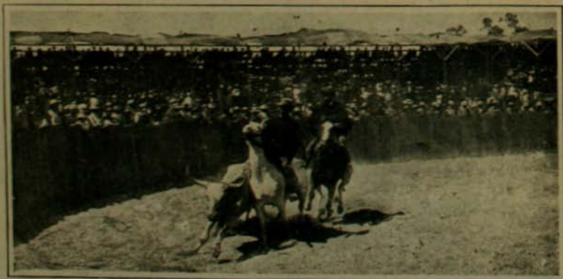
Un momento difícil

"ponchos" multicolores, sus espuelas de rodaja colosal y sus "chuzos" amaestrados al estilo del país. Se hizo la "aparta" de un grupo de novillos, se organizaron topeaduras entre huasos del norte y del sur y se ballaron cuecas con trajes de caracter. La fiesta del Domingo ha sido un brillante éxito, por el cual felicitamos a los organizadores que de este modo contribuyeron a despertar las características costumbres de nuestros campos, que van desapareciendo rápidamente.