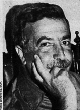
"Conozco a mi país de la cabeza a los pies y a su pueblo compartiendo vidas, dolores, trabajos, alegrías y resucitamientos", sostuvo.

Cerca de su muerte escribió "los médicos me han dicho que padezco de una enfermedad que se llama Tomé y no existe ningún fármaco para curar ese mal irreparable". Días después se quitó la vida en su propia "galaxia". Sus restos descansan en el cementerio de Tomé, frente al mar y en el lugar donde se quitó la vida hoy funciona la Casa de Arte Laberinto.