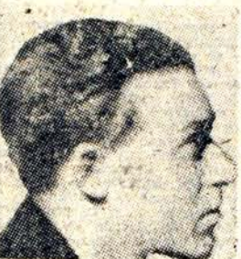
HUGHES PANASSIÉ junto a Tommy Dorsey. El más notable crítico de jazz, y el más célebre trombonista, actuando en una "jam session" improvisada en el teatro Paramount de New York.

pues era traducido al inglés, y aumentado apareció en los EE. UU. de N. A. Obra de real importancia, analiza las diversas corrientes de esta música negro-americana. Puntualiza claramente los estilos, como señala las características de los principales solistas negros y blancos. Dedicó un capítulo íntegro a Louis Armstrong, el trompetista de color, tal como a Duke Ellington y su orquesta.