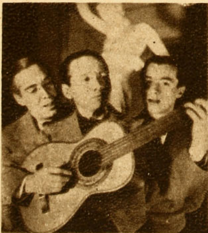
El conjunto de «Los Dodos».

Agreguemos que los tres tocábamos ukelele, y que algunos números se hacían con los ukeleles y se comprenderá el grado de entusiasmo que un conjunto así debía obtener en el público. Notábase la agradable-sorpresa del auditorio en números como "Love me tonight" (no el de la película del mismo nombre), cuando cesaba repentinamente la orquesta y quedábamos los tres solos, cantando acompañados por nuestros ukeleles. Era como una re-