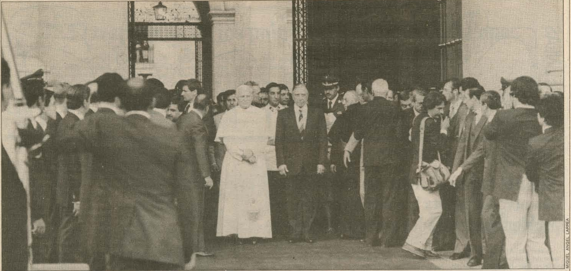
El Presidente Augusto Pinochet acompañó hasta la puerta de La Moneda al Papa Juan Pablo II, después de la audiencia privada en La Moneda.

Salieron juntos al balcón y el Pontífice oró en la capilla del palacio