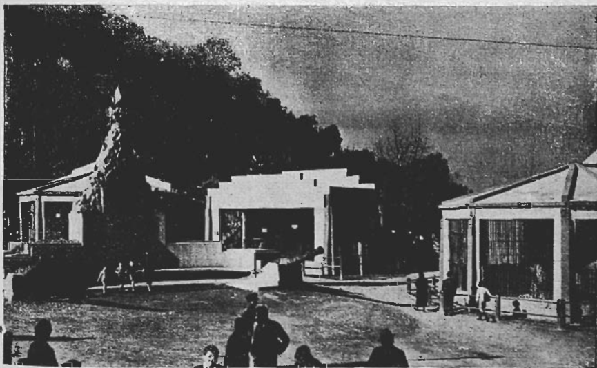
UNA SECCION DEL JARDIN ZOOLOGICO DE SANTIAGO. AL CUAL ACUDE NUMEROSA CONCURRENCIA EN LAS TARDÉS DE PRIMAVERA.

El mes de septiembre es, como decíamos, un mes esencialmente "santiaguino".