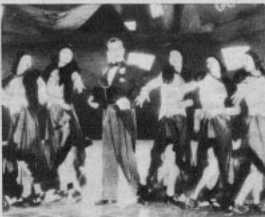
Una escena de «EL IDOLO DE BROADWAY».

DADO EL ESPIRITU de imitación que domina en los estudios hollywoodenses, era de esperar que después del triunfo de «Me lodia de Broadway», aparecieran varias películas con nombre parecido. Así, el teatro