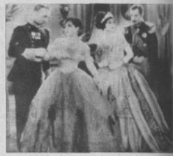
Una escena de «MELODIA DE AMOR».

Esta película es dirigida por David Goltz.