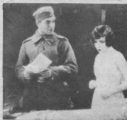
Una escena de «KARL Y ANNA».