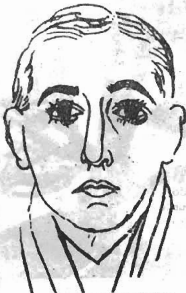
Vicente Huidobro visto por Picasso