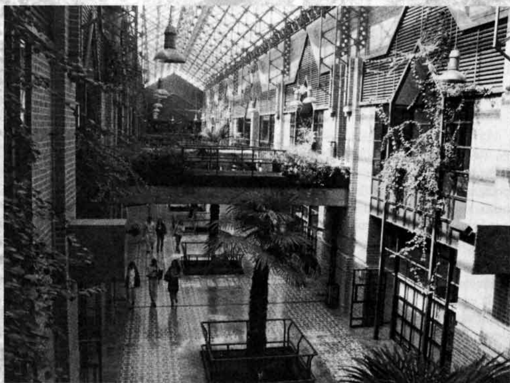
Interior del nuevo edificio de la Facultad de Administración y Economía.