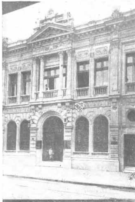
Fachada del Banco Italiano

Las actividades del Banco Italiano son, en general, todas las del ramo: admisión de depósitos en cuenta corriente, a la vista y a plazos; cobranza de documentos; descuento de letras; préstamos en cuenta corriente y en pagarés, etc.