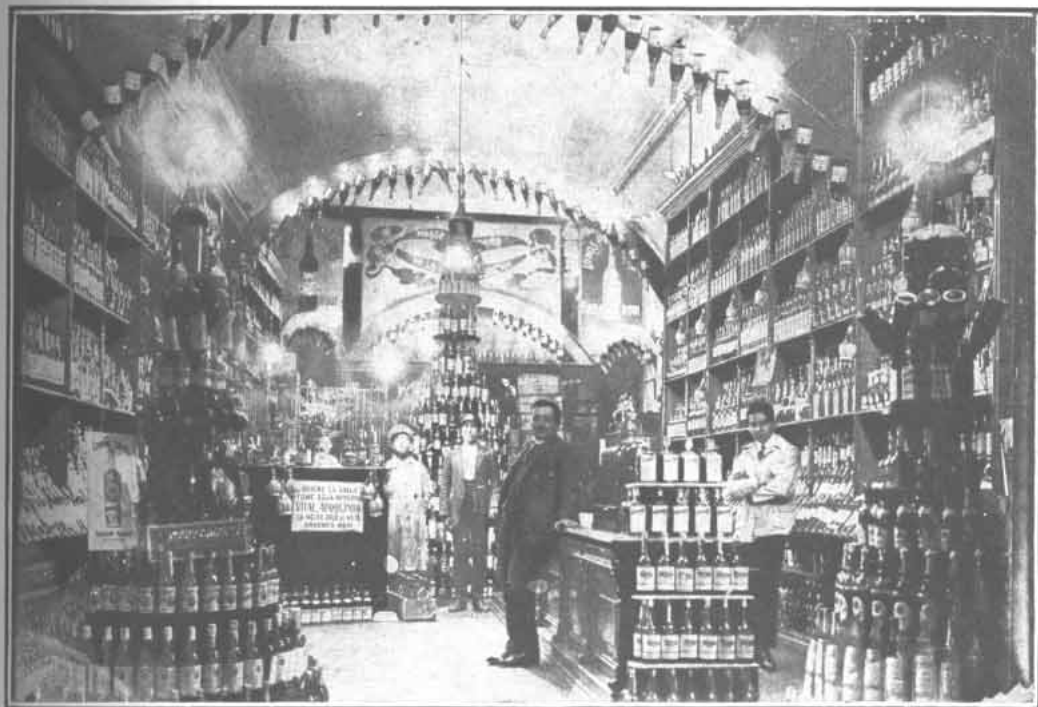
Interior de la Botellería Porteña, en la calle Condell

Hace poco más de dos años se estableció en Valparaíso, en la calle de Condell, N.º 212, un gran almacén de licores surtidos, tanto extranjeros como del país, de propiedad del conocido comerciante en esta clase de mercaderías, señor Eugenio Zerbi.