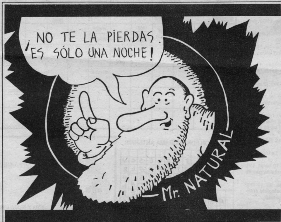
Mr. Natural en el sugerente afiche-invitación: una creación del legendario Robert Crumb, quien los 60 se identificó con el vanguardismo de la cultura hippy