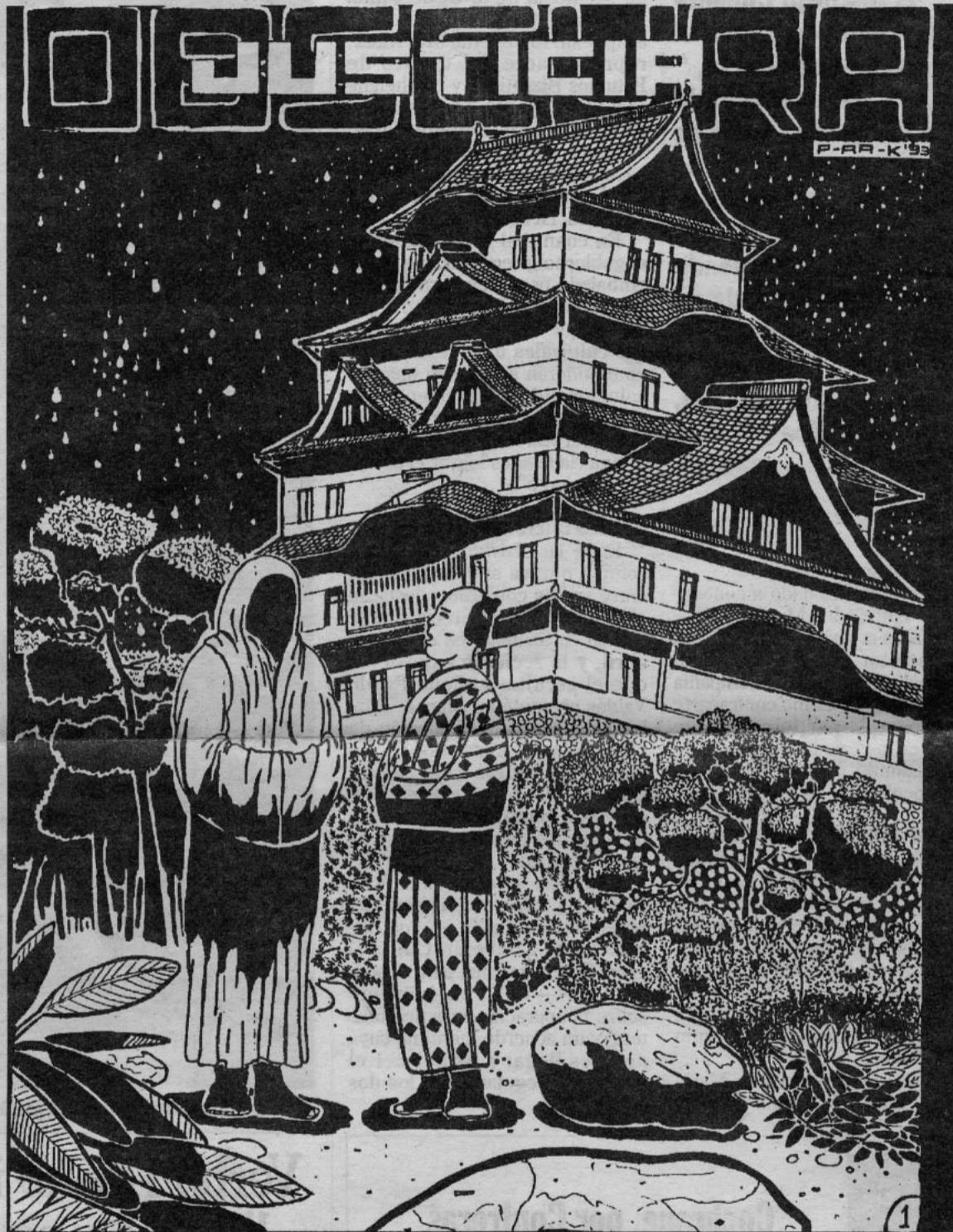
Una obra del taller de cómics de la Casa de la Juventud del INJ de Valparaíso.

Todas estas actividades fueron organizadas desde varios meses por la productora Vértigo quien invitó a los creadores y seleccionó a la gente nueva que participaría en este evento, que bastante gente congregó. A pesar de algu-