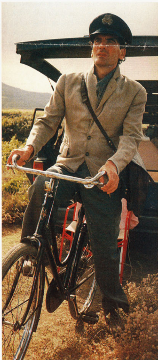
Massimo Troisi durante el ensayo de Il Postino di Neruda : "¿Es el mundo entero una metáfora de algo?"

El encuentro tuvo lugar en su casa una tarde de otoño, en la que pude comprobar con placer y asombro que había una secreta relación entre mi cartero Mario y la atmósfera que irradiaba la expresividad de Troisi. Las coincidencias eran hasta entonces casi mágicas: Il Postino tiene una curiosa mezcla de ingenuidad, impertinencia, humor y melancolía, y el comediante Troisi había logrado su éxito en el cine gracias a su comicidad matizada por un dejo de tristeza y cierto asombro ávido, una tensión irresistible hacia algo vago y hermoso. Por cierto que lo había admirado en sus filmes dirigi-