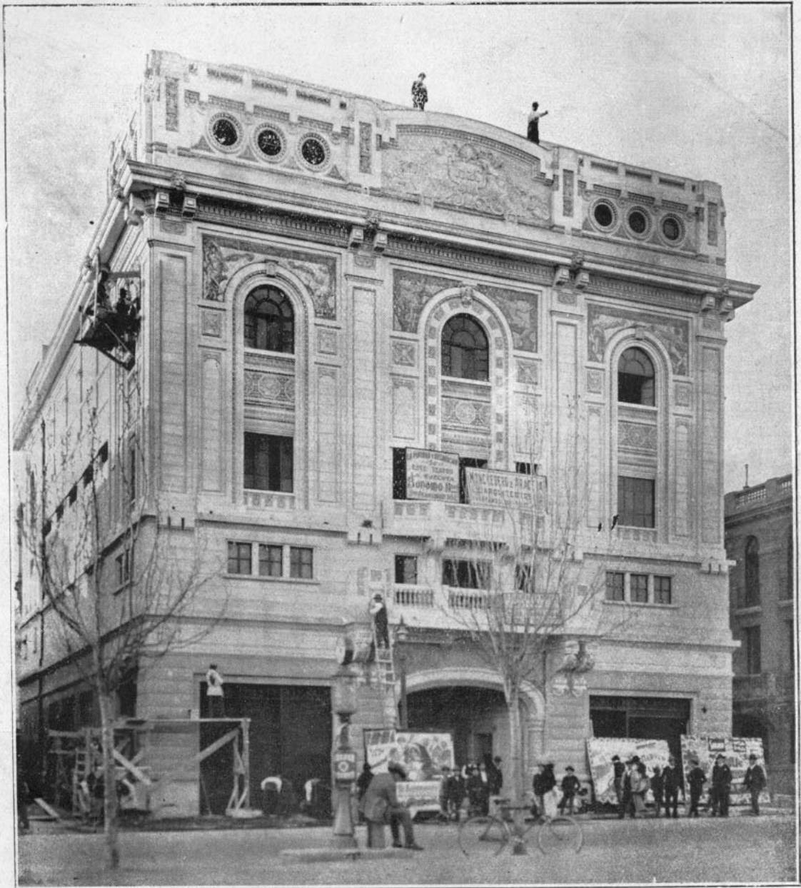
Fachada Teatro Carrera