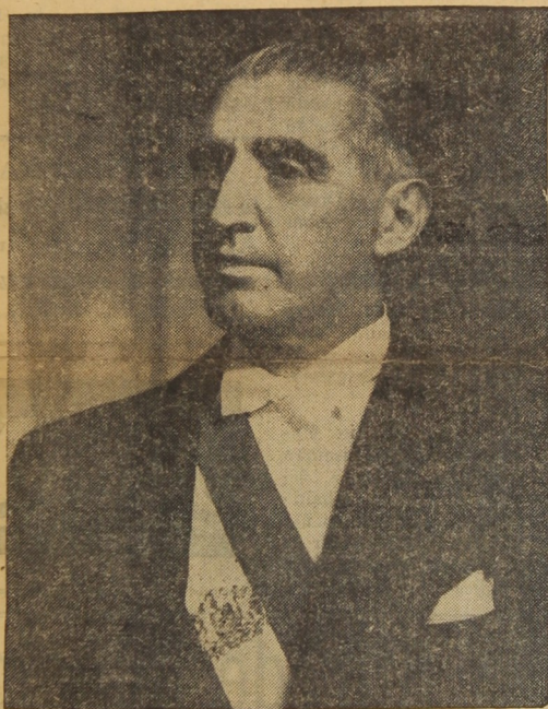
Don Juan Antonio Ríos Morales RECIENTEMENTE FALLECIDO

— Sr. PRESIDENTE DE LA REPUBLICA DE CHILE —