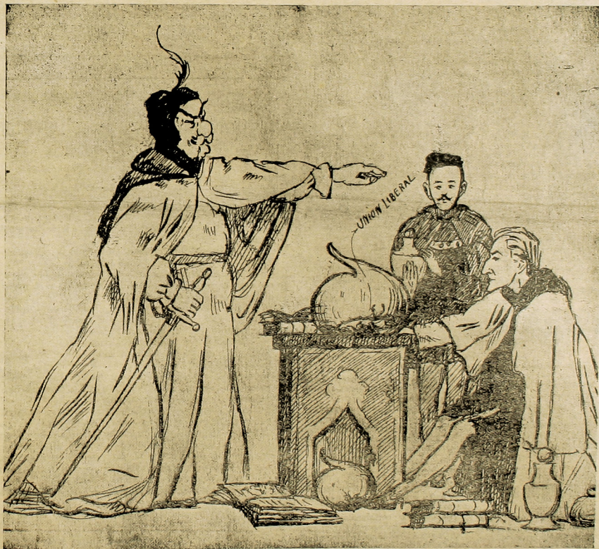
El alquimista en su retorta...