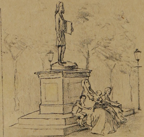
y, delante de su estatua pedían limosna su viuda é hijos.