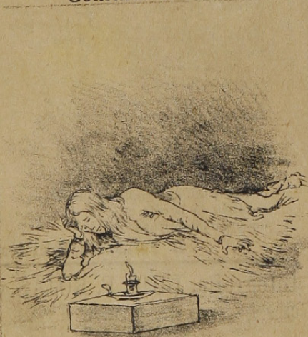
Al fin murió de miseria.