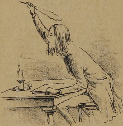
Comenzó á escribir...