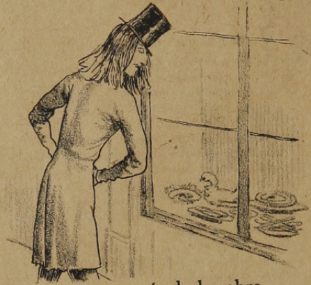
que se moría de hambre delante de los escaparates.