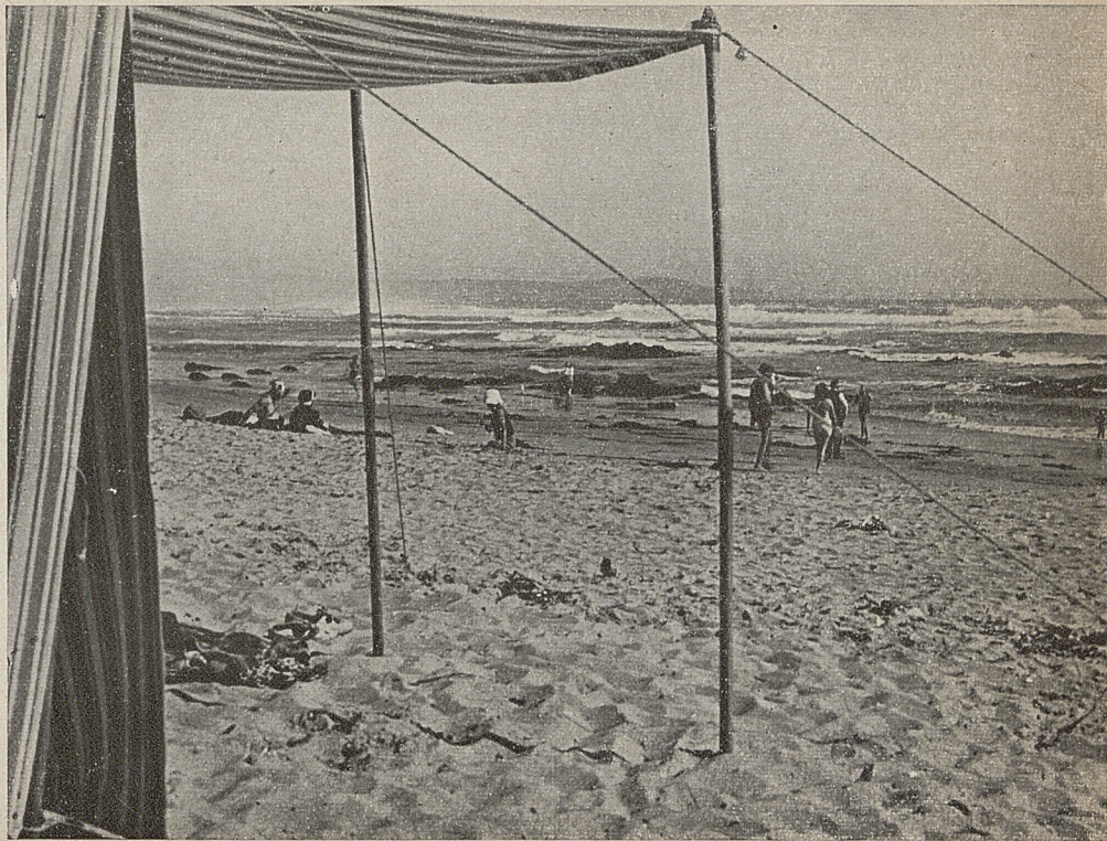
PLAYA DE EL TABO

A continuación, y a fin de orientar en mejor forma al turista, consignamos, en una breve reseña, las principales características de las más conocidas playas chilenas. Como en el caso de los sitios de turismo, hemos omitido los balnearios del norte (los hay de magníficas características), debido a que no es posible llegar a ellos, desde la región central, con la comodidad que el viajero puede exigir.