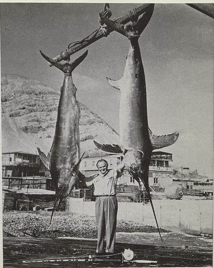
EJEMPLARES GIGANTES PESCADOS EN TOCOPILLA.

Coquimbo. — Es el puerto principal de la provincia de su nombre, con 17.000 habitantes. Allí inverna la flota de guerra. Muy cerca de él se encuentra Andacollo, famoso por su producción