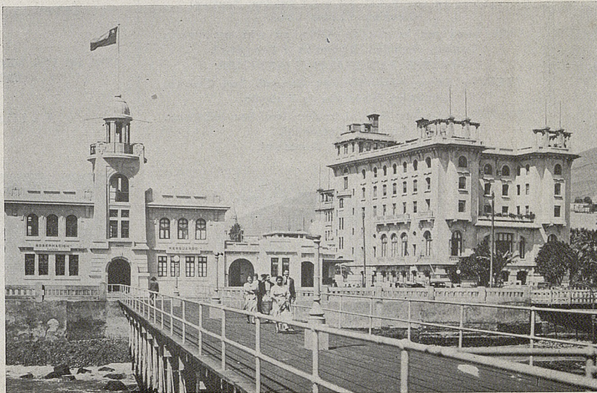
ARICA - HOTEL PACIFICO

Arica. — Palabra venida del aimará, Arica significa: Puerta Nueva. Es, geográficamente, el primer puerto y considerado como la puerta de entrada a Chile. Por el interior, se llega