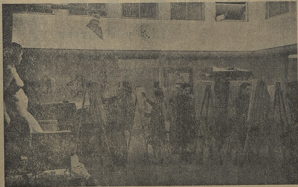
ESCUELA DE BELLAS ARTES

o Casa de la Cultura para el Pueblo. Un día de velada.