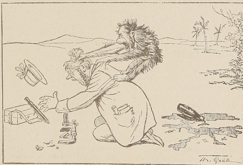
3.—El mono—¡Toma! aprende a burlarte de la jente seria!