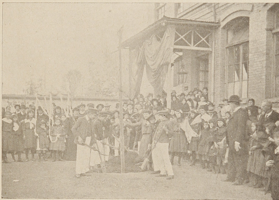
Los alumnos de las Escuelas de la Sociedad de Instruccion Primaria plantando árboles en las calles, en el momento de colocar el árbol en su sitio: la madrina lo sostiene i los padrinos echan la tierra.