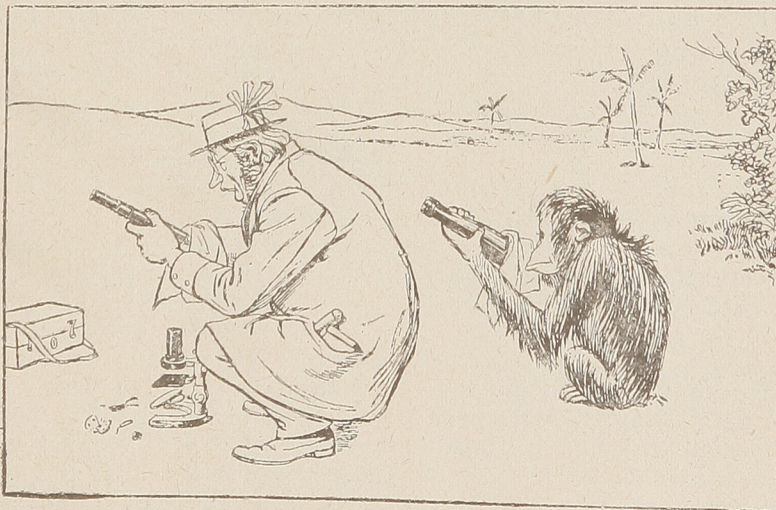
1.—Mientras el sabio monta su telescopio, el mono aprovecha su ensimismamiento para practicar idéntica operacion con la botella.