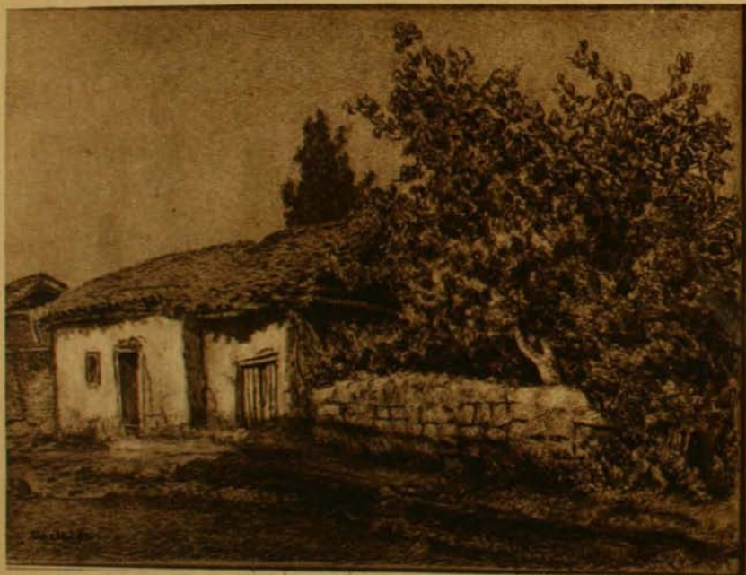
Casitas de Chillán Viejo.

Pero si con alguien puede emplearse sin temor este género de alabanzas, es, sin duda, con Dorlhac: unánimemente, admiradores y no admiradores concuerdan en reconocerle una ejecución insuperable, cuan-