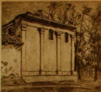
Iglesia de campo.

no les gusta que les digan místicos, ni que les alaben "el ideal"; estos dos términos se han desacreditado por el abuso, como sucedió en literatura, después del Romanticismo; ellos quieren, ante todo, realizar la forma, coger fuertemente la materia y dar la impresión de la vida animal en la más vigorosa manera posible. Eso de misticismo les suena