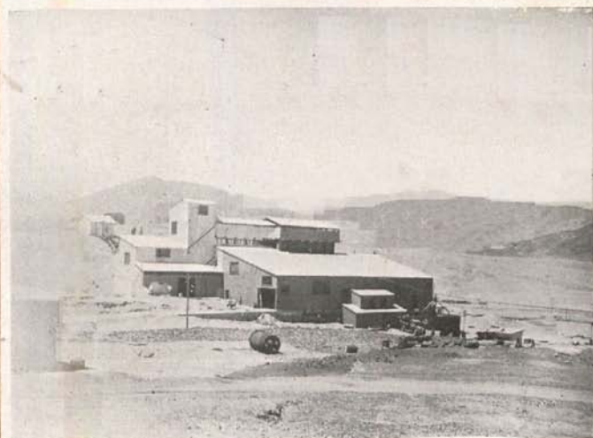
Departamento de Chañaral.—Planta Regional de concentración construida por la Caja de Crédito Minero en El Salado.