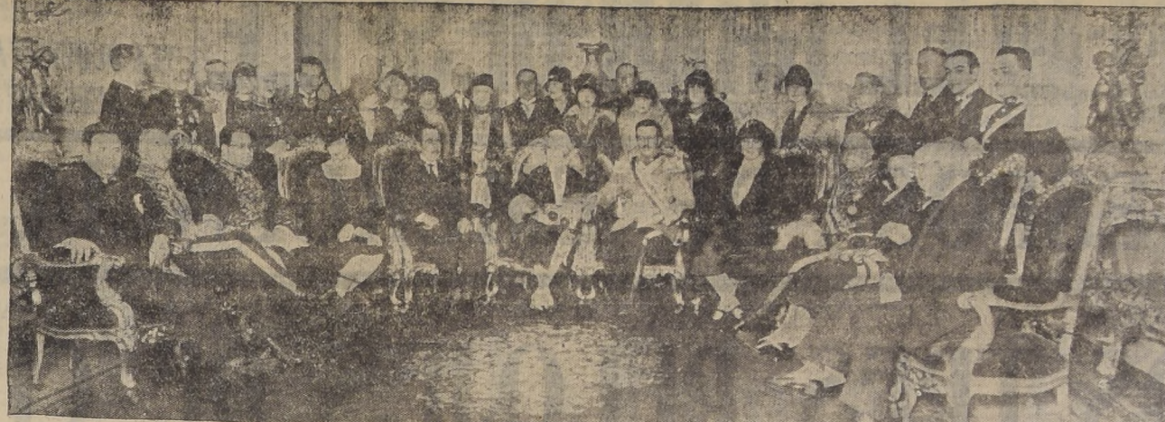
S. E., rodeado del Cuerpo Diplomático en el Salón de Honor de la Moneda, después de la ceremonia de la posesión del Mando

CLUB DE SEÑORAS.— Tienda Protección al Trabajo Femenino.— Libretas que tienen pago hoy Viernes, de 2 a 4.— Números: 2, 14, 4, 23, 24, 34, 39, 60, 68, 86, 101, 104, 118, 133, 171, 174, 191, 214, 218, 245, 299, 305, 345, 365, 399, 406, 421, 448, 459, 479, 530, 495, 524, 530, 532, 534, 538, 550, 578, 600, 607, 615, 622, 631, 647, 649, 650, 654, 655, 656, 663, 664, 685, 689, 672, 674, 675, 684, 682, 686, 694, 696, 697, 700, 703, 708, 709, 715, 720, 721, 731, 738.