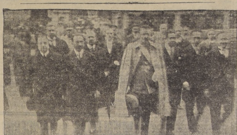
El Excmo. señor Ibáñez llegando al Congreso

ACADEMIA TECNICA MILITAR Ha sido aprobado por el Ministerio el programa de admisión de alumnos a la Academia Técnica Militar para 1928-29.