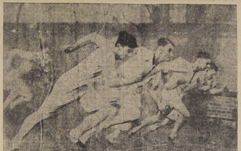
de ligereza de la Universidad de Cambridge, en un entrenamiento para el match que, unidos a los de Oxford, sostuvieron con los estudiantes americanos de Yale y Harvard...