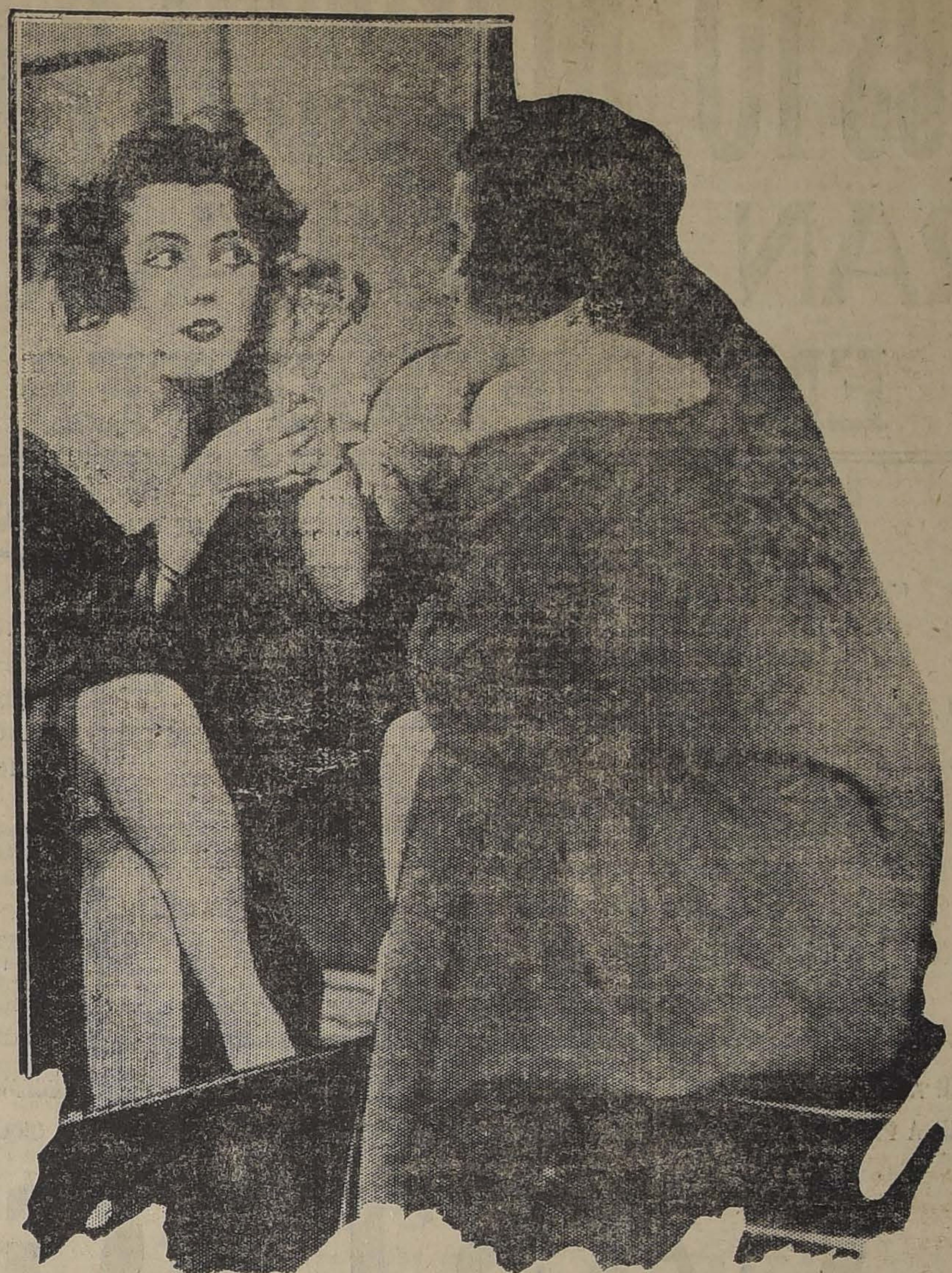
ES TAMA ENTRE LOS ARTISTAS Y LITERARIOS DE PARIS, QUE MLEE DORANNE POSEE LOS MAS ADMIRABLES OJOS DE LA GRAN CIUDAD LUZ. EL GRABADO REPRESENTA A MLEE. DORANNE EN EL INSTANTE EN QUE SE DEDICA CON PRIMOROSO CUIDADO AL EMBELEQUEAMIENTO DE SUS GRANDES OJOS.