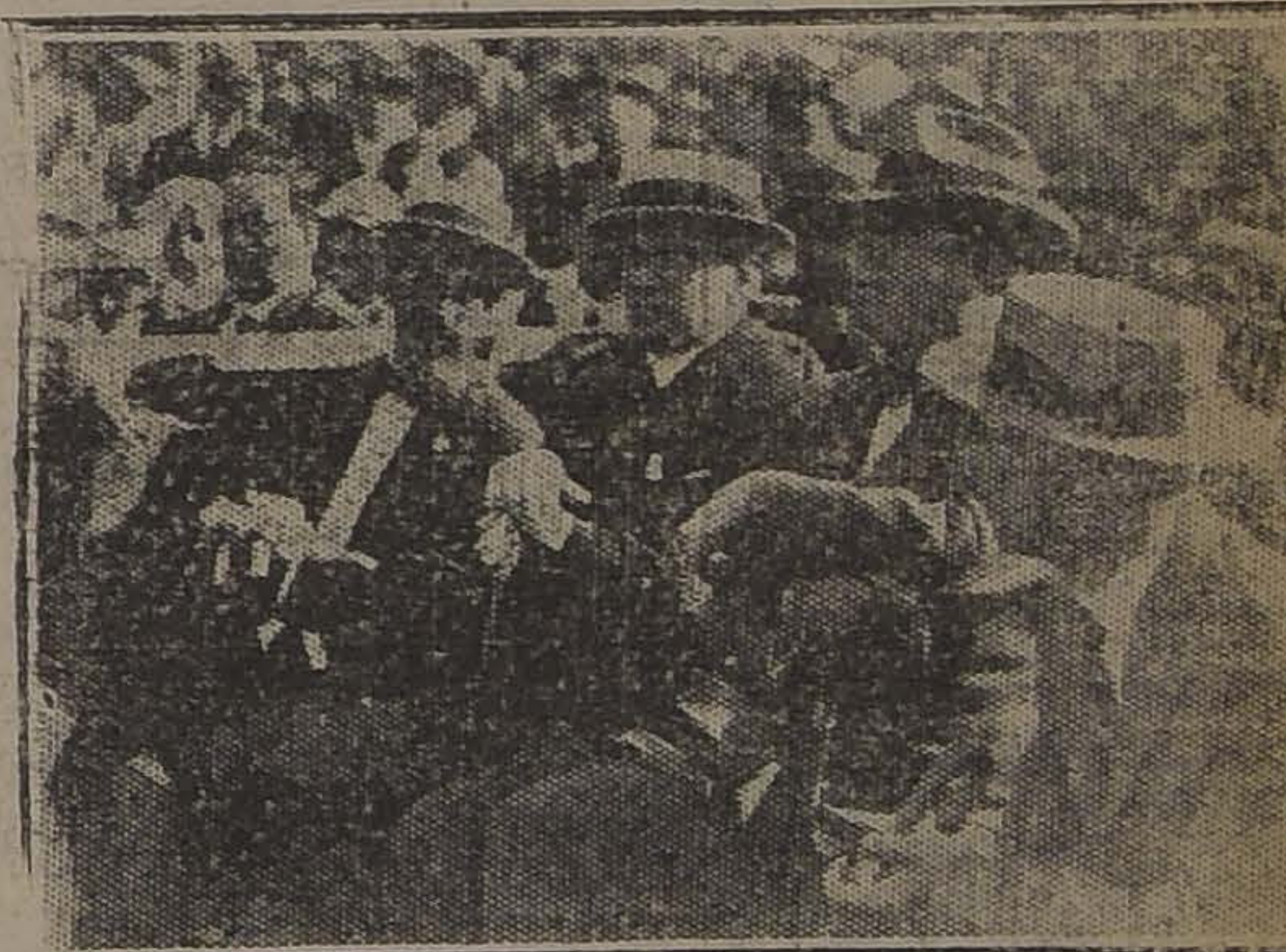
EL PRESIDENTE DE LA REPUBLICA ACOMPAÑADO DEL PRESIDENTE DE LA FEDERACION DE BOX, PRESENCIANDO EL ENCUENTRO

Tercer round.—El público principia a impacientarse y se oyen algunas exclamaciones de las gradas, los peleadores exigen más actividad. El referee señor Matte llama la atención en repetidas ocasiones a los boxeadores para que apuren su tren de pelea.