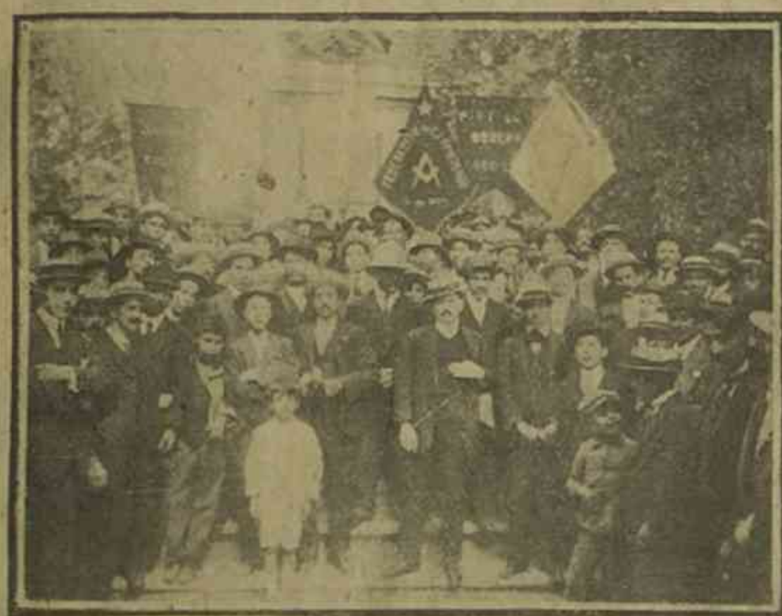
Algunos de los asistentes al Comicio

El informe mencionado, posiblemente sea entregado al Excmo. señor Sanfuentes a fines de la semana entrante.