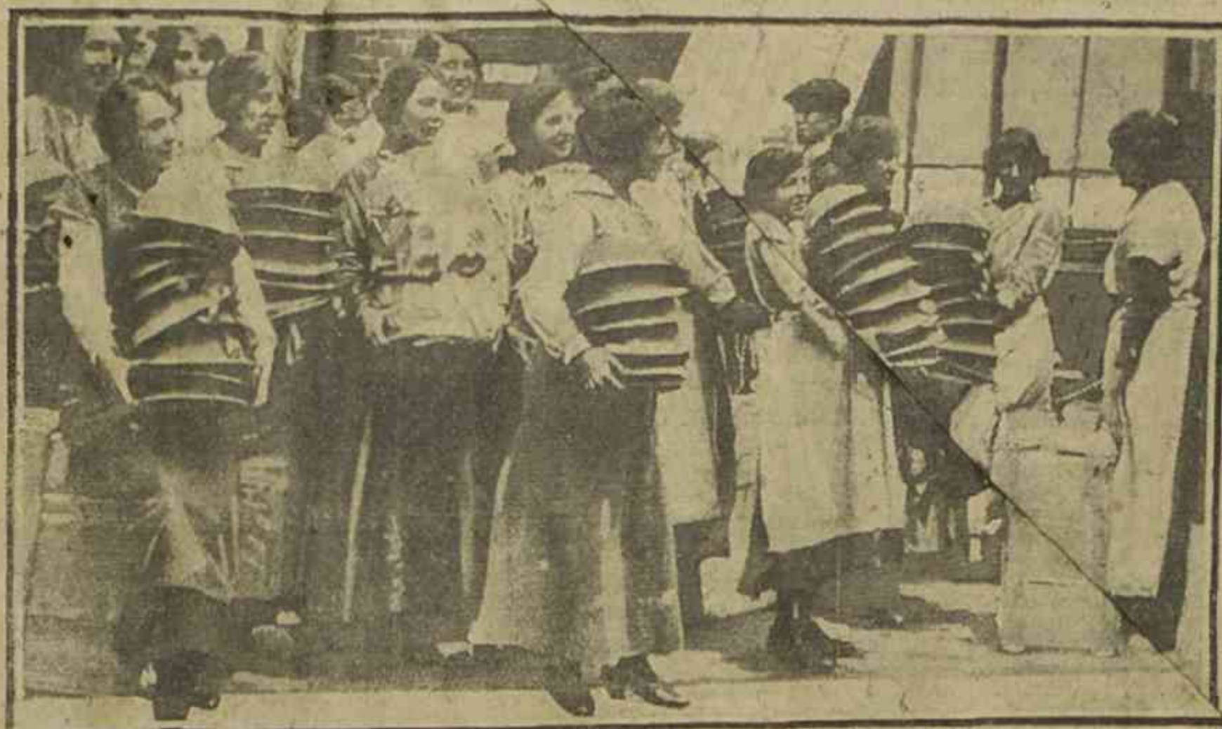
Algunas de las mujeres francesas que se ha encomendado la confección de cascos de acero para los millones de hombres que integran el ejército de los aliados