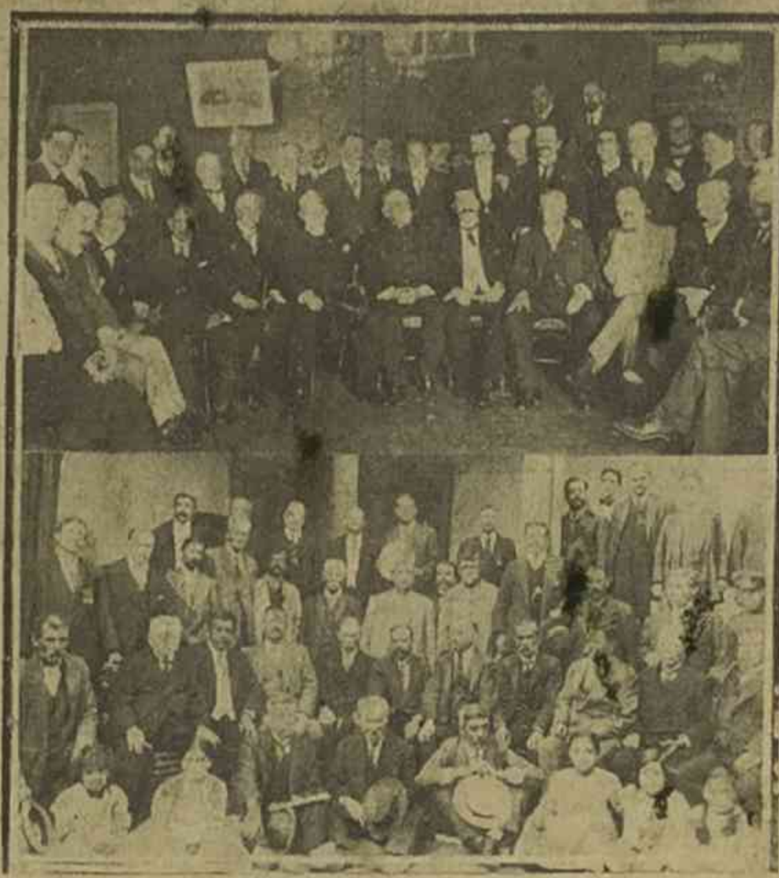
En la Liga patriótica Militar. Asistentes a la fiesta de la Sociedad de Veteranos del 79