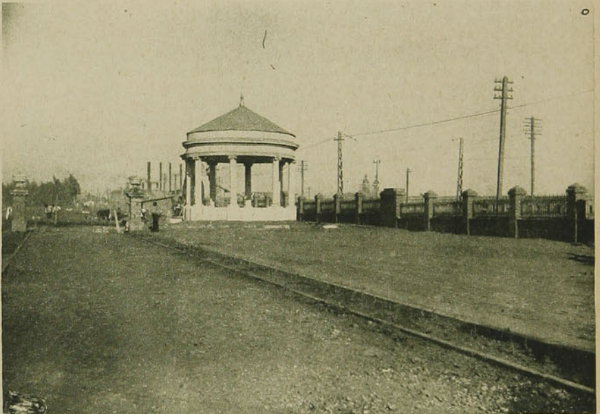
La pérgula, donde se cultivarán rosas y claveles.

Se ha hecho ya lo más. El camino está trazado para quienes inspirados en un justo cariño a la educación física de nuestro pueblo, quieran prestar su concurso a dar término a una obra que ya se ha iniciado y que está destinada a servir al desarrollo de los deportes y al entretenimiento del público y en especial de las clases trabajadoras que aman los sports.