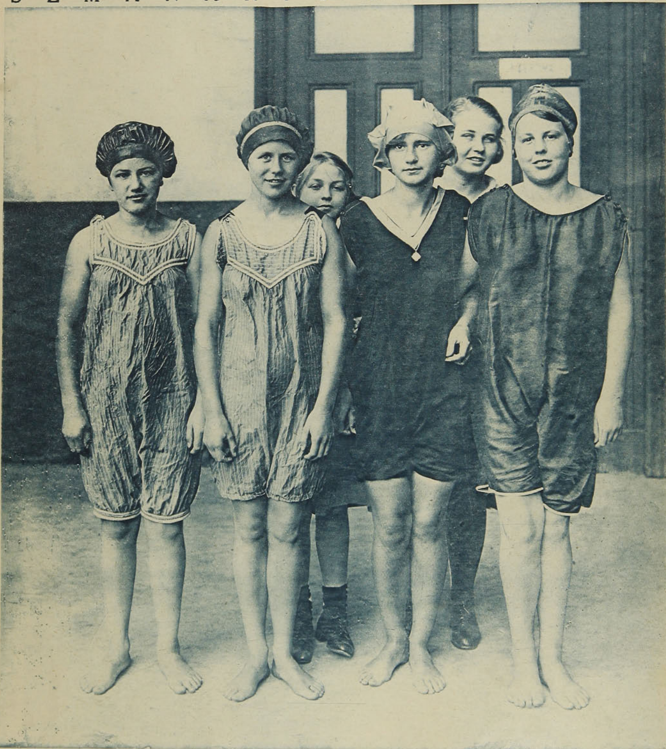
Las vencedoras en el Concurso de Natación verificado en la hermosa "piscina" de los Baños del Parque, en Valparaíso, entre alumnas del Colegio Alemán