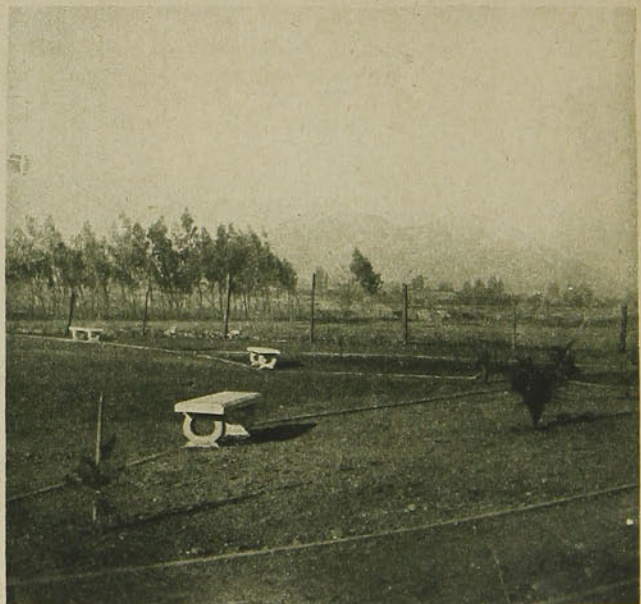
Otro rincón del Estadio.