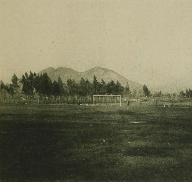
La cancha de foot-ball.