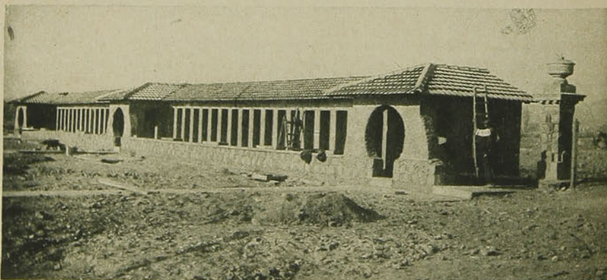
Las casuchas de los baños.

Luego sobre aquel terreno se diseñaban las diversas pistas y partiendo del Oriente, veía-