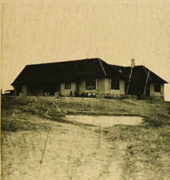
La casa del Club.

En una hermosa meseta que se levanta al oeste de la Población Vergara, están situados los espléndidos "links" construídos para la prestigiosa institución denominada Valparaíso Golf Club, campo deportivo que no sólo es un timbre de honor para el primer puerto del país, sino también para Chile, pues, es una demostración elocuente del progreso de la cultura física entre nosotros.