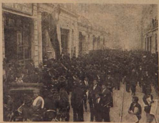
Frente a la secretaría aliancista en la calle Bandera, durante los disturbios. En la puerta se ve la bandera nacional con crespones por la muerte del diputado D. Guillermo Eyzaguirre Rouse.

los cuales con cierta razón, creen que el triunfo ha debido corresponder a la Alianza Liberal.