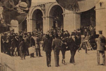
Los electores reunidos en la plazuela del Teatro Municipal, esperando el momento de sufragar.