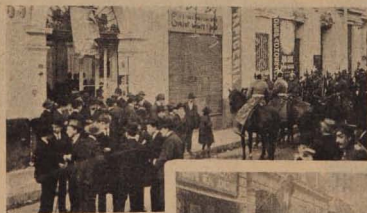
Frente al Club Conservador, después del encuentro entre aliancistas y coalicionistas. Tropas de carabineros restableciendo el orden.