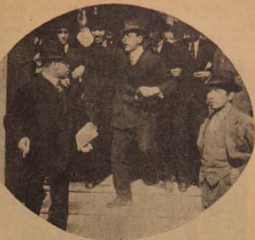
Una comisión contra el cohecho expulsando a uno sorprendido infraganti.