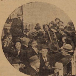
En Alameda frente a Lira: ciudadanos que reparten garrotazos por amor a los candidatos.

en la superioridad indiscutible del candidato coalicionista vimos que la Alianza pudo sacar cuatro electores más desahogadamente, a pesar de los grandes esfuerzos que hicieron los partidarios del señor Sanfuentes para defender sus colores. Como dato curioso podemos mencionar el hecho de que en la 7. a comuna, cuyos tra-