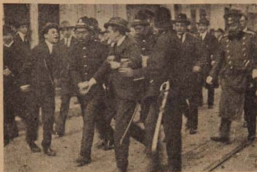
Un manifestante conducido a la Comisaría durante los grandes desórdenes del viernes en la calle Agustinas, frente a la secretaría coalicionista.

Como los lectores se habrán impuesto por la lectura de los telegramas de provincias, la Coalición se bate en retirada, recurriendo al fraude y a la falsificación de los escrutinios en diversos puntos del país.