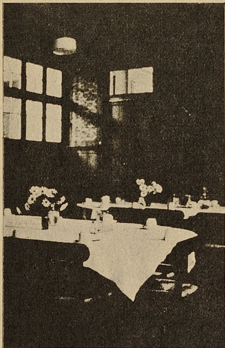
Vista parcial del comedor