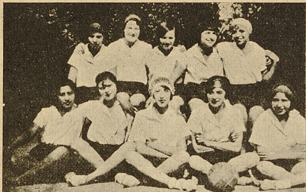
Un grupo de alumnas en una tarde deportiva

eficazmente en el restablecimiento de la salud de los enfermos.