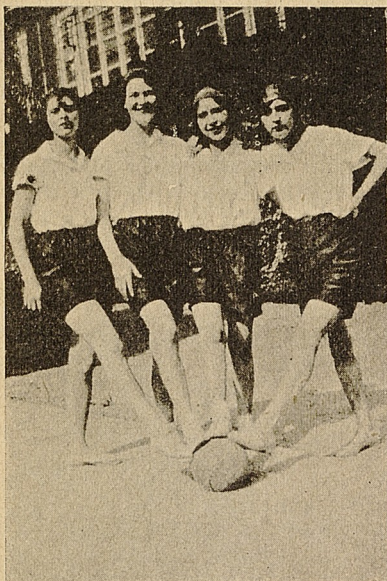
El uniforme deportivo de las alumnas

Art. 26. Se exigirá a las alumnas el más riguroso aseo en sus personas, vestidos y dormitorios.