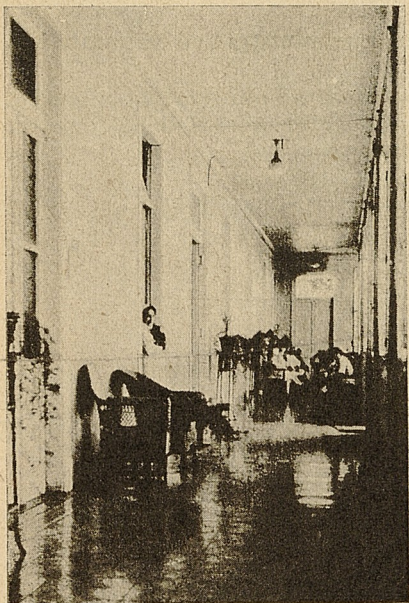
Vista de una de las galerías interiores .

Art. 19. La Dirección formará con las postulantes una lista por orden de mérito y aceptará como alumnas a prueba a aquellas que figuren en los primeros lugares, en un número igual al de las plazas vacantes. Se dará preferencia a las solicitantes que posean su licencia secundaria. Si alguna de las