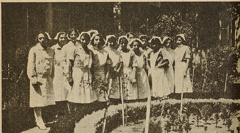
Un grupo de alumnas con uniforme

En igual forma se indicarán las horas y la forma en que se podrán solicitar libros de la Biblioteca.