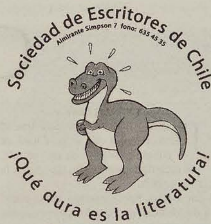
Autoadhesivo irónico contra la Sech.

Argumenta que la indignación que los embarga se produce porque ellos no representan al gremio, con suerte sólo a un 10% de los escritores de Chile. "Y el problema es que manejan recursos, no muchos, pero que no merecen", afirma el denunciante anónimo, y añade que "no tenemos intenciones de pole-