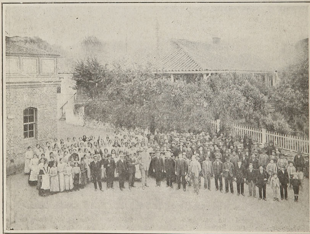
Jefes, maestros y parte de operarios de la fábrica