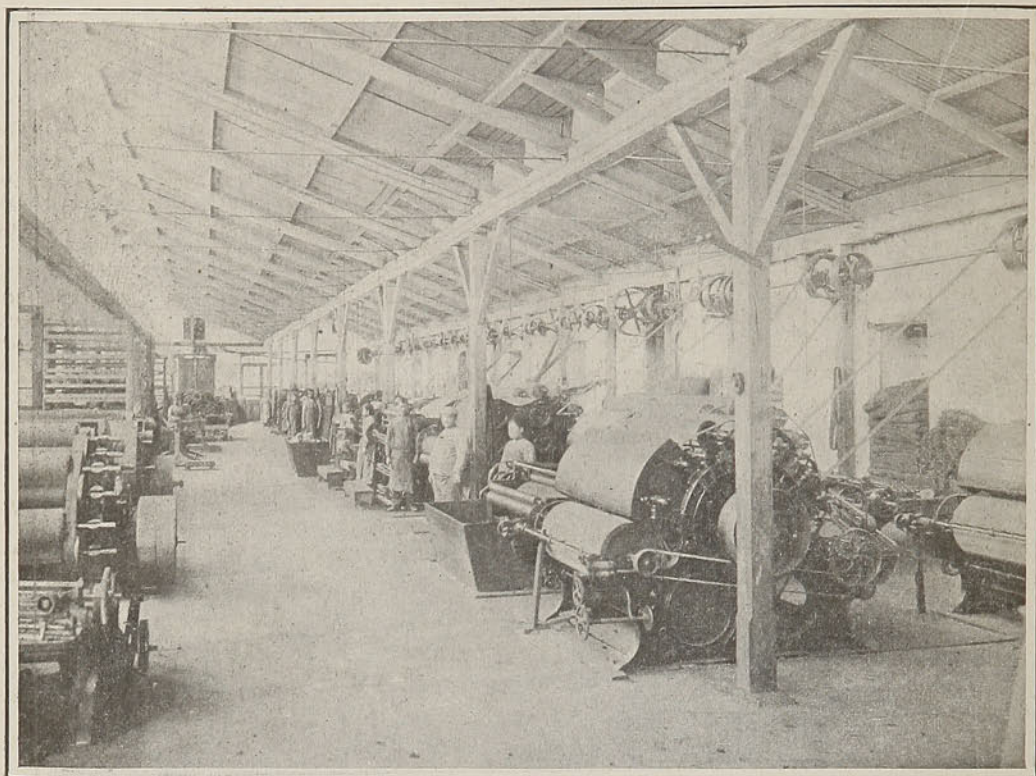
Sala de cardería