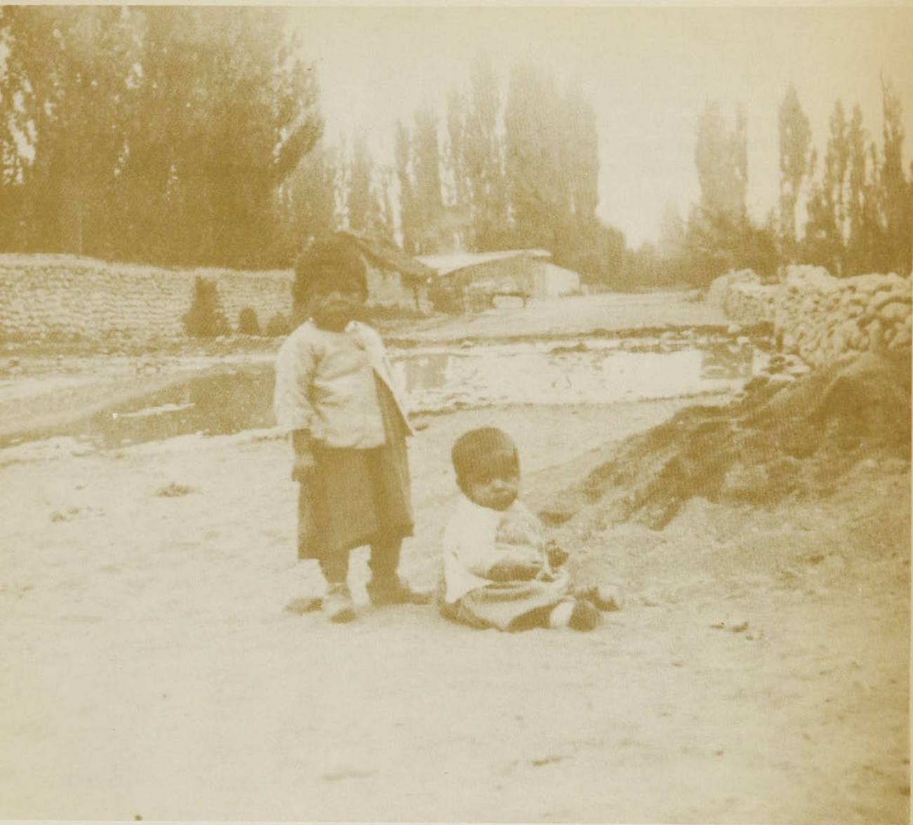
"... DECIDIR EL ABANDONO DEL NIÑO ..." Copia de placa de vidrio de Alberto Lira Orrego. Colección Museo Histórico Nacional