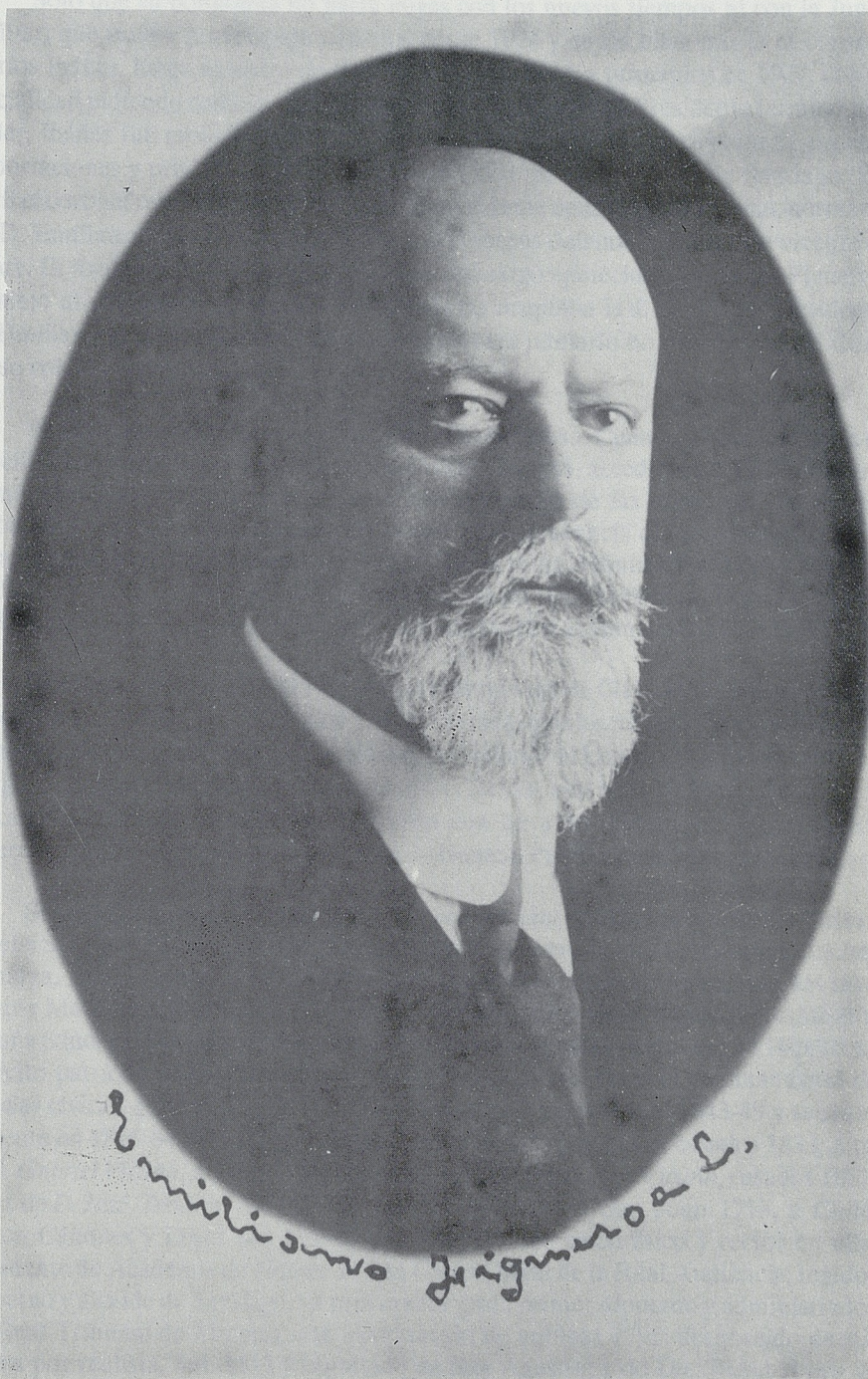
DON EMILIANO FIGUEROA LARRAIN VICEPRESIDENTE Y PRESIDENTE DE CHILE