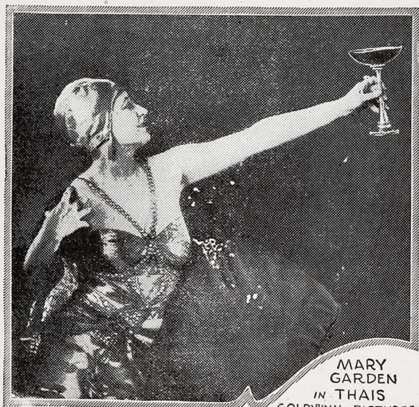
MARY GARDEN IN THAIS GOLDWYN PICTURES