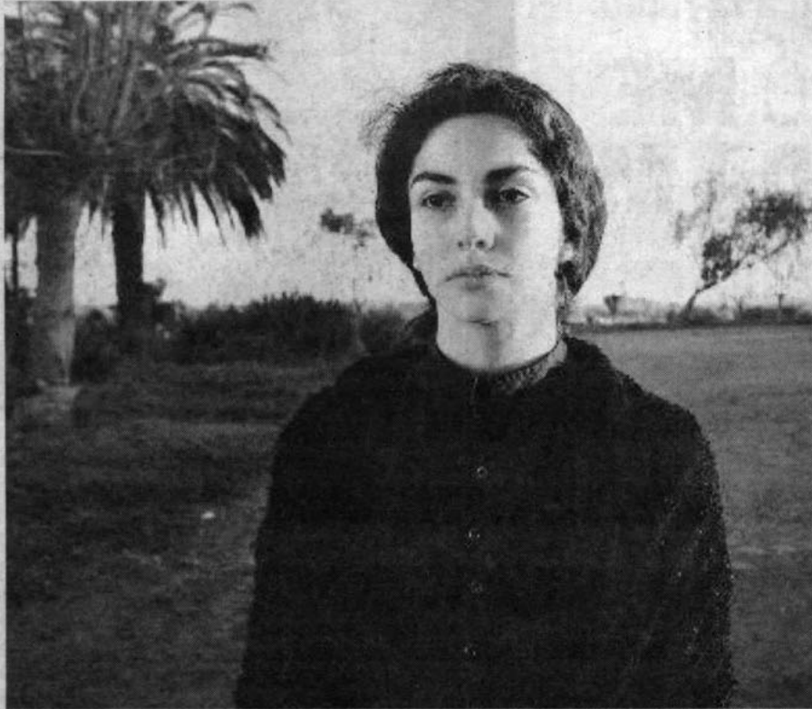
Según el periodista, El Desquite y El Entusiasmo no entran en el esquema de un 'cine de transición'. "Elas caminan en otra dirección", argumenta.

Huérfanos y Perdidos es el sugerente título de la última obra del destacado periodista, que se refiere a los dos tópicos más recurrentes de las películas chilenas en el período 1990-1999. El volumen ofrece un análisis del contenido de las cintas y no se detiene en una crítica hacia ellas.