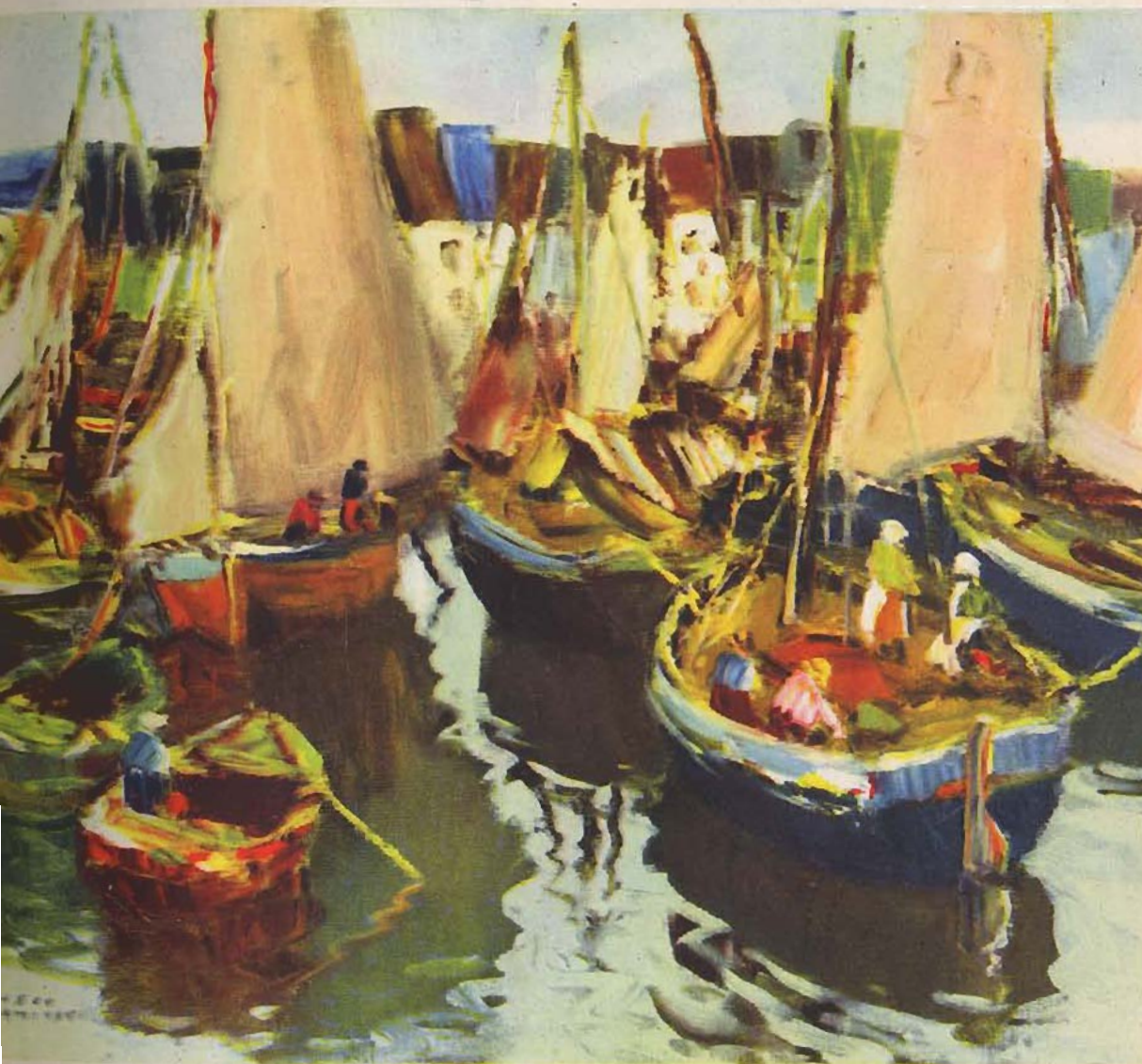
VELAS SOBRE ANGELMO.— De Pacheco Altamirano.