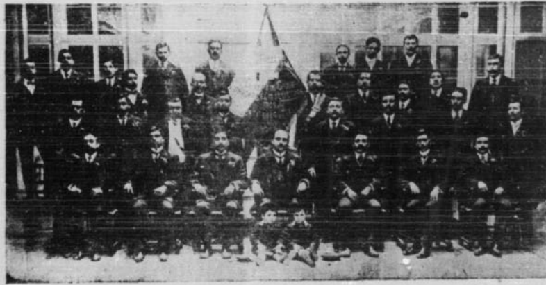
La Junta Ejecutiva de la Federacion Obrera de Chile

Si logramos realizar estos deseos, breve i ligeramente trazados, consideraremos satisfecha nuestra honrosa mision.