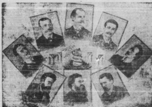
Los Mártires de Chicago

Las glorias de los ricos, sus pompas, sus honores encuentran por do quiera mentidos trovadores, pero existe otro canto de sin igual grandeza: el canto que consagra el pobre a su pobreza.