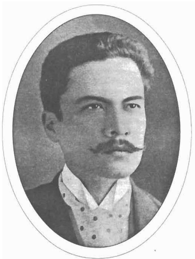
Rubén Darío en Chile alrededor de 1886