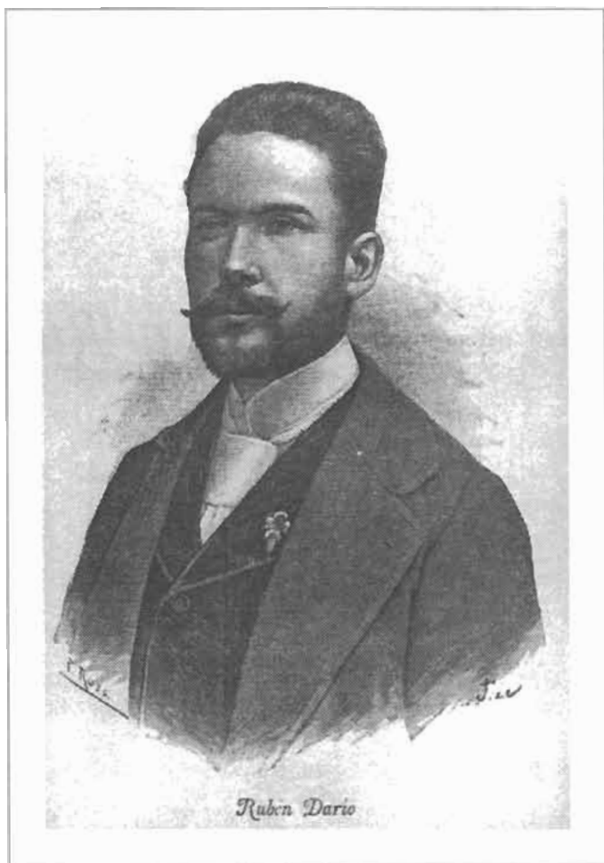
Rúben Darío durante su primera estancia en Argentina, entre 1892 y 1898