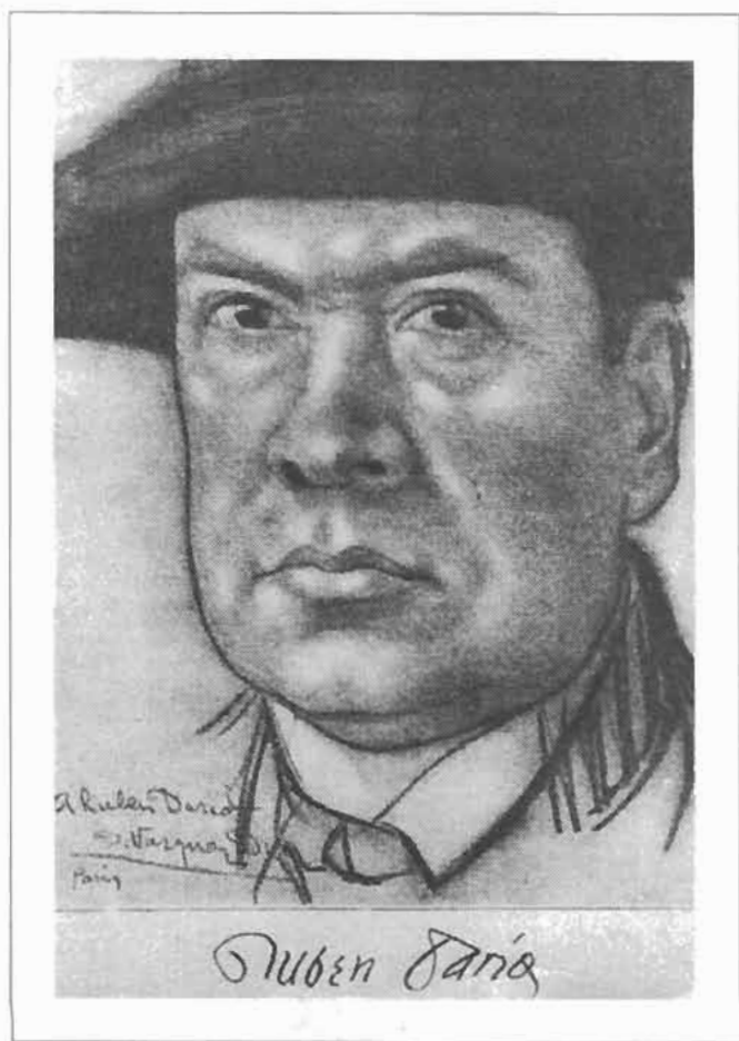
Rubén Darío por Vázquez Díaz, París 1911