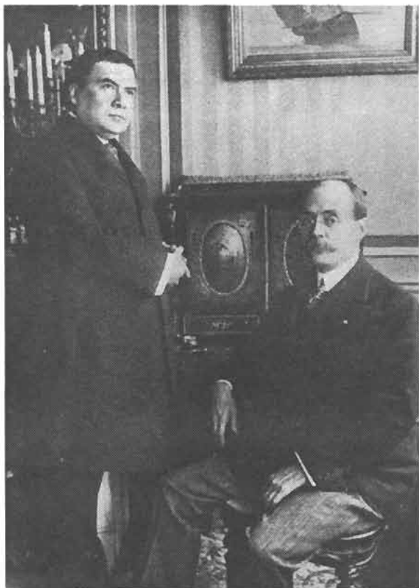
De pie, Rubén Darío