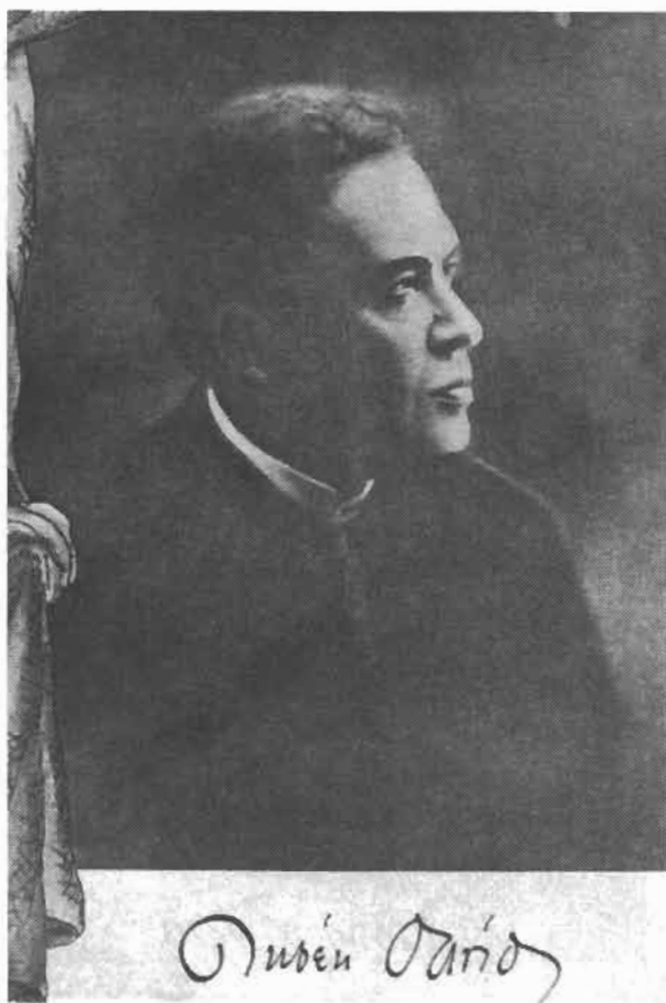
Rubén Darío en New York, 1915