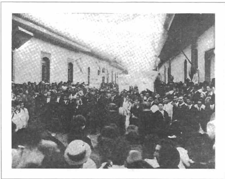
El cuerpo de Darío es conducido a la Catedral de León el 3 de febrero de 1916