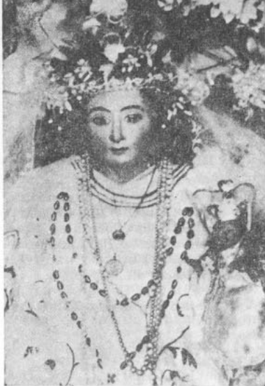
La Virgen de las Peñas, que se venera desde 1642. Su fiesta se celebra, en octubre la ceremonia grande, y en diciembre, la chica. A estas fiestas concurren más de 4.000 personas, que dan extraordinaria animación al Santuario durante cuatro días

Se cuenta que unos indios arrieros la descubrieron hace más de tres siglos. Uno de ellos, que tenía a su mujer muy enferma, le pidió le diera salud a la compañera que se le moría; cuando éste llegó a su rancho, la mujer estaba sana.