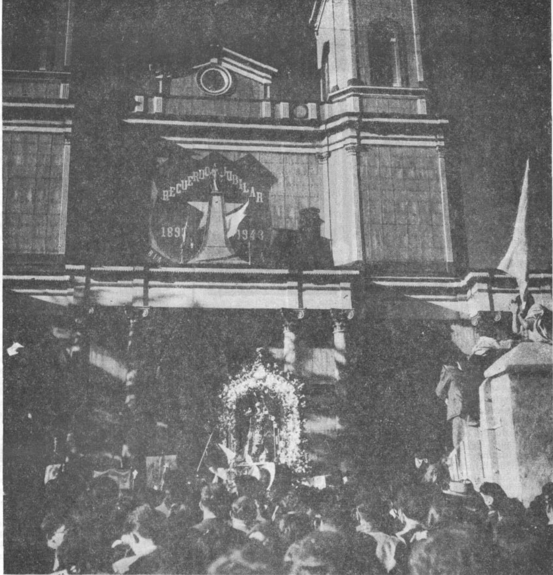
La Virgen de Andacollo (Anda Cori, región del oro) saliendo del templo, cuya imagen la rodean hombres de profundidad y de silencio búdico, que una vez al año hacen resonar la superficie de la tierra, creando un convivio de unción, danzas y música