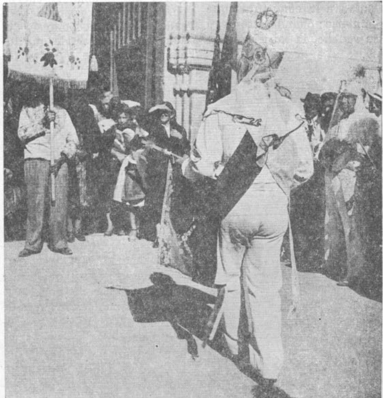
Los "turbantes" es la segunda comparsa que apareció en el año 1752, y la integra sólo una compañía de 20 a 30 individuos