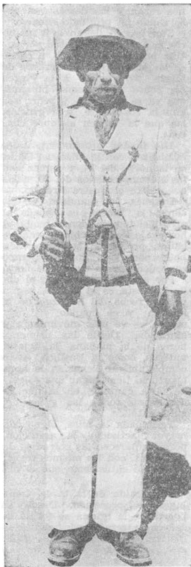
Un "alférez" andacollino es el jefe del baile: lo presenta a la Virgen y desde ese momento no cesan de danzar delante del templo, hasta que llega la noche

to su bandera o pendón, danzaban al compás de sus flautas, con las que producían un ruido infernal.