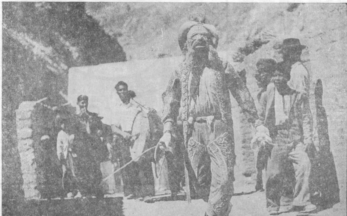
Un "diablo" recorre el poblado cercano al Santuario, durante la celebración de Andacollo

A esta fiesta de la montaña de Andacollo, a esta romería nacional, acuden muchos millares de peregrinos; algunos años se ha calculado hasta en cincuenta mil