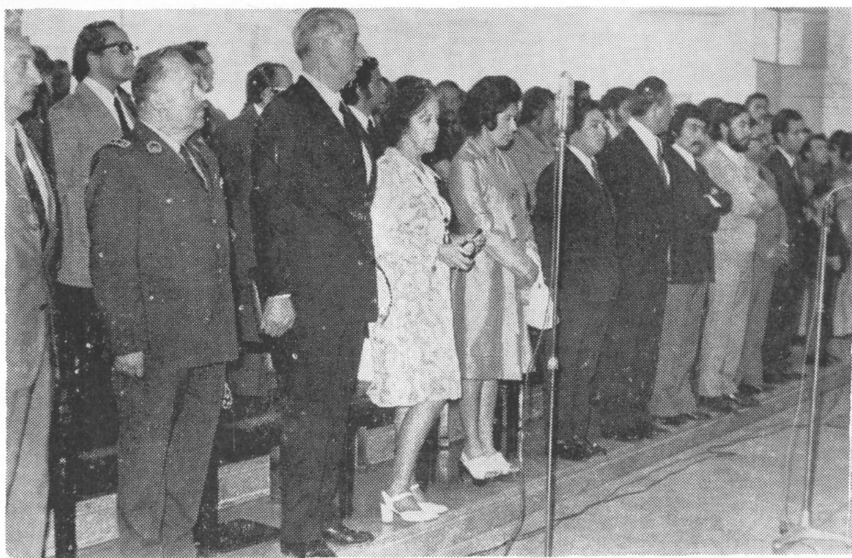
“Arriba, de pie...” Autoridades universitarias y de Carabineros escuchan con respeto el Himno de la Universidad de Concepción.