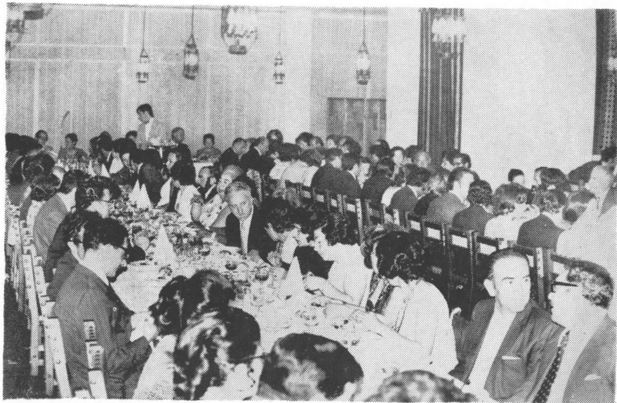
Docentes y no docentes, en la comida en honor al rector y al vicerrector. Más de cuatrocientos adherentes reiteraron el reconocimiento de la Universidad a las autoridades que se alejan de sus cargos administrativos.